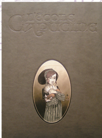
Couverture de l'album